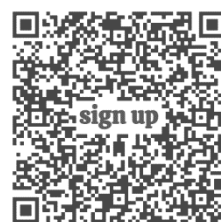
新生生活營報名表

報名網址： https://forms.gle/QZgHbH3sKpOUjvcG8 。